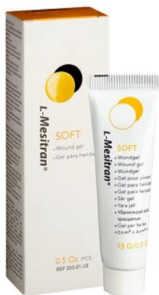
Figura 4 Gel e unguenti a base di miele per la guarigione delle ferite sono disponibili in commercio in molti Paesi ( https://www.basefarma.it/l-mestran-soft-50g )