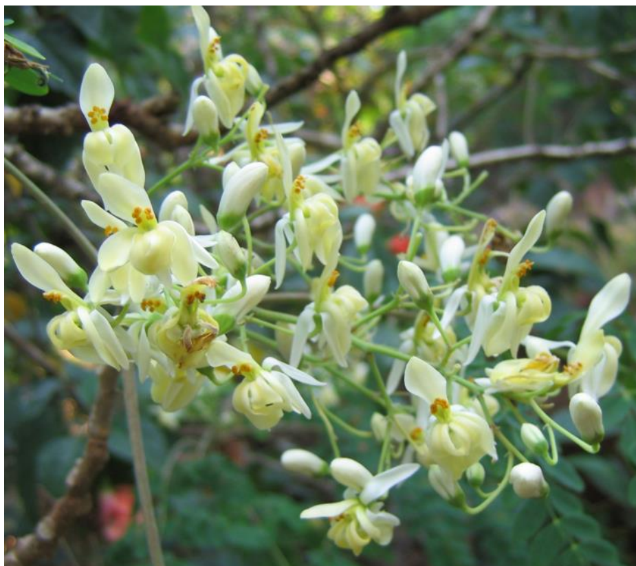
Figura 2 Moringa oleifera , specie arborea originaria di zone subtropicali è apprezzata per le sue proprietà campo medicinale

In modo simile, in Nigeria sono state studiate diverse provenienze di miele per lo studio della loro azione sulle ferite e ulcere causate dal diabete (Obakpororo Ejiro Agbagwa et al. , 2022). In questo caso sono stati usati ratti Wistar. I risultati ottenuti indicano che il miele è un'alternativa efficace per il trattamento delle infezioni delle ferite e possiede le qualità necessarie per essere considerato una cura standard per il trattamento delle ferite diabetiche. L'aggiunta di estratto vegetale di moringa ( Moringa oleifera ) al miele, in uno dei trattamenti a confronto, ha migliorato notevolmente i risultati. Va ricordato che la specie Moringa oleifera ( Figura 2 ), originaria di zone subtropicali, è apprezzata per le sue proprietà benefiche e la sua versatilità in campo alimentare, medicinale e cosmetico.