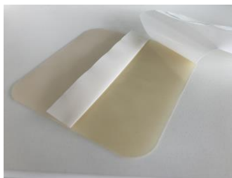
Figura 3 Idrogel DracoHydro Hydrogel-Wundauflage impiegato per veicolare sostanze terapeutiche

Un gruppo di ricercatori britannici, turchi e di Singapore affermano (Mieles et al. , 2022) che gli usi commerciali e terapeutici del miele e il suo impiego sperimentale nelle tecniche di ingegneria dei tessuti sono in continua crescita. Attualmente, nanofibre elettrofilate, idrogel ( figura 3 ) e criogel, schiu-