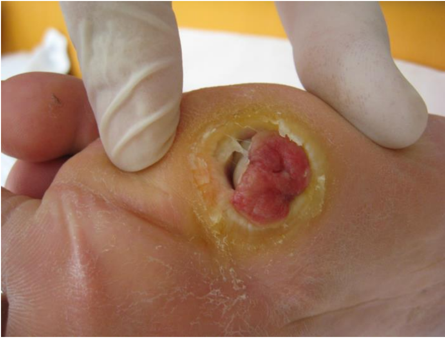
Figura 1 Ulcera del piede diabetico

al. (2020) descrivono gli ottimi risultati ottenuti in termini di riduzione dei tempi di guarigione delle lesioni trattate, vengono inoltre espone le caratteristiche chimiche e fisiche del miele medicale che ne spiegano in forma scientifica l'azione svolta.