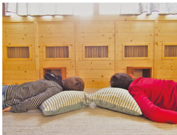
Foto 4 | Apisound all'interno dell'Apiario del Benessere® a Centrale di Zugliano (VI)

Chi segue un trattamento di respiro dell'aria dell'alveare in un Apiario del Benessere® si arricchisce simultaneamente dell'ascolto del ronzio delle api che in virtù della sua frequenza (432 Hz), favorisce uno stato di benessere e rilassamento. A questa frequenza, infatti, le onde Alfa sono stimulate positivamente favorendo un equilibrio tra i due emisferi cerebrali, si migliora così lo stato di rilassamento e si facilita la meditazione. Il ronzio delle api ( apisound ) ha la stessa frequenza e potere rilassante del fruscio delle foglie, lo scorrere di un ruscello o la risacca del mare. Infatti, la frequenza di 432 Hz è strettamente connessa ai cicli della natura.