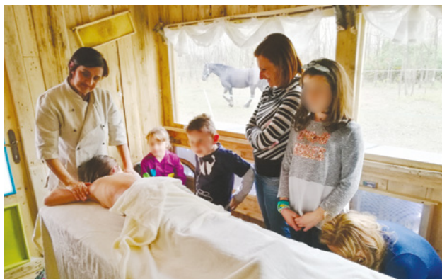
Foto 6 | Nell'Apiario del Benessere® l'apicoltore può offrire competenze, benefici per corpo e mente, prodotti dell'alveare e ospitalità

L'apipetdidattica è destinata ad un pubblico vasto ma soprattutto a bambini e ragazzi, comprese le scolaresche, mentre sono adulti preparati adeguatamente i responsabili di trasmettere conoscenze ed emozioni. Si tenga conto che superare la paura è, per i più giovani, una strada verso l'autostima (foto 5) e che sono le emozioni a fissare il vissuto. Il soggetto ideale per svolgere l'apipetdidattica è l'apicoltore stesso, poiché interagisce costantemente con le api e conosce a fondo gli argomenti che suscitano le curiosità dei visitatori. Da segnalare che la visione dell'apicoltore vestito con tuta e maschera schermata mentre ispeziona l'alveare tramite l'affumicatore suscita grande interesse da parte dei partecipanti che spesso non hanno mai assistito a operazioni di questo tipo. Comunque, molti gestori di fattorie didattiche, di aziende agricole e di agriturismi sono