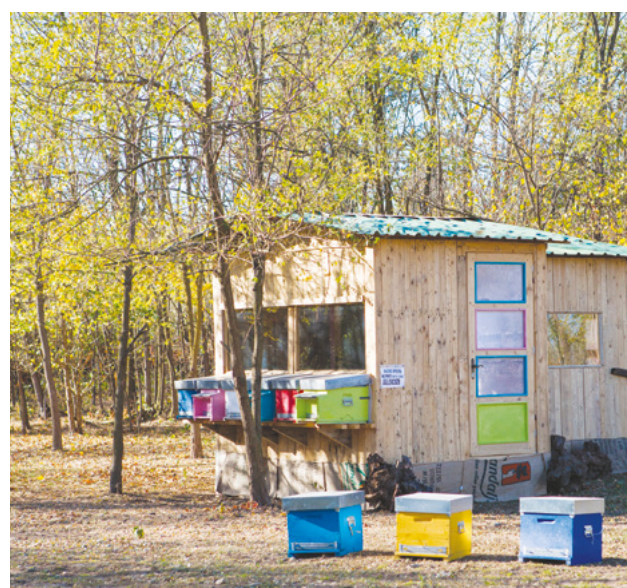
Foto 1 | Apiario del Benessere® a Borgo d'Ale (VC)

Per la respirazione dell'aria dell'alveare, nei paesi dell'Est vengono spesso usati dispositivi inalatori (maschere rigide) coadiuvati da ventilazione forzata, collegati direttamente all'alveare da un tubo. Appaiono analoghi agli ina-